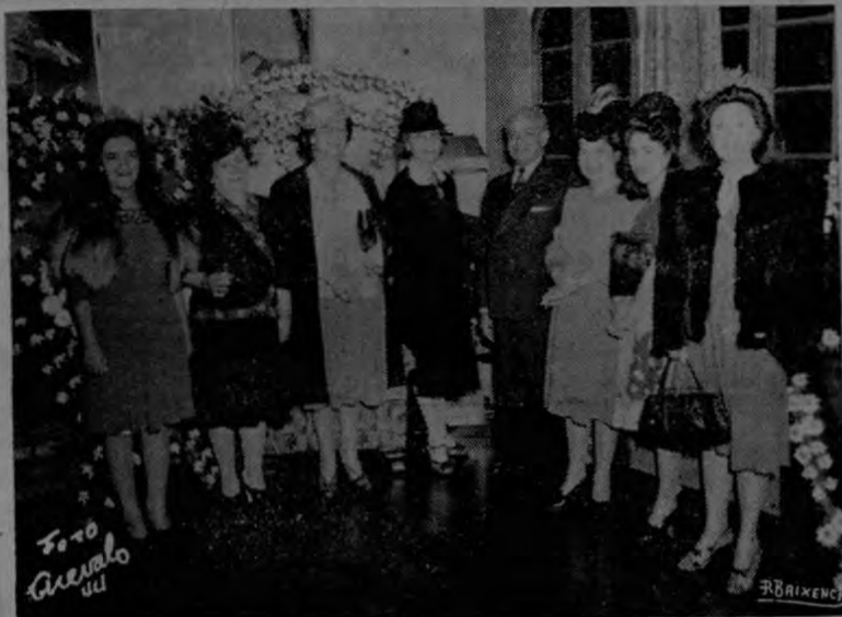
Grupo de señoras asistentes a la fiesta, rodeando al distinguido Ministro doctor César Tolentino, quien está trabajando, con laudable empeño, por estrechar los lazos de unión entre su pueblo y el nuestro.