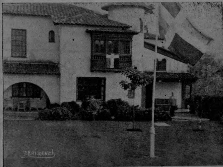
Fotografía tomada el memorable 27 de enero. Aparece el señor Ministro Tolentino, quien atendió con exquisita amabilidad a la numerosa concurrencia que llegó a saludarlo en tan fausta fecha.