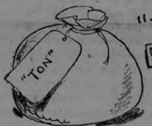
GOUELIN - de TOLOSA, Francia ESCRIBIO SU TESTAMENTO CON UNA SOLA PALABRA: "TUYO"

CIFRAS PALINDROMÁTICAS 11^2 = 121 111^2 = 12321 1111^2 = 1234321 11111^2 = 123454321